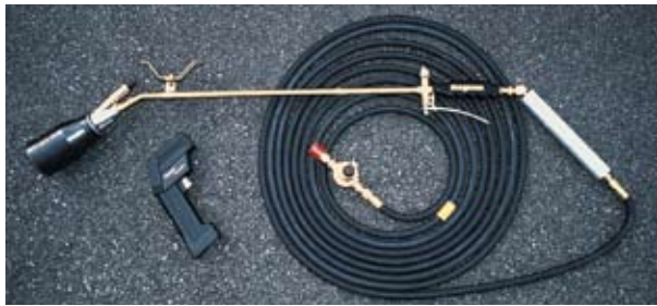
Antorcha Magnum y Termómetro Infrarrojo.

La instalación de HotTape™ es fácil, segura, rentable con una antorcha como la Magnum y un termómetro infrarrojo. Se requiere precalentar el área a una temperatura específica antes de la aplicación.